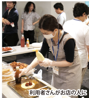
利用者さんがお店の人に