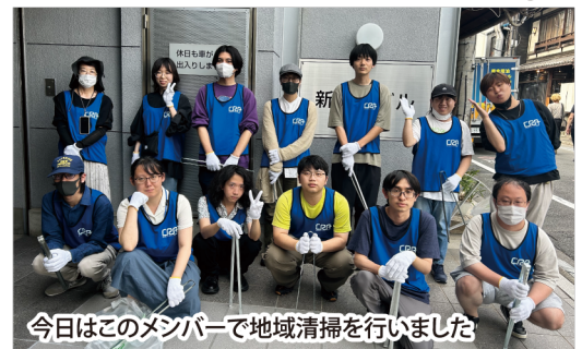
今日はこのメンバーで地域清掃を行いました

6月26日(水)に、毎月恒例の地域清掃活動をおこないました。この日は天気が良く気温も高かったので、普段は1時間かけて清掃を行うところを30分に短縮して清掃活動を行いました。