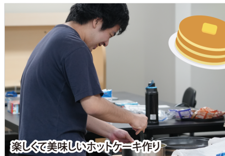
楽しくて美味しいホットケーキ作り

6月22日(土)、CRAワークサポートセンターにて「ホットケーキを作る会」を開催しました。これは、CRAワークサポートセンターの利用者さんが、自分たちでホットケーキを焼いて食べる会で、定期的に開催している名物企画です。会にはおよそ8名の利用者さんが参加されました。参加されたある利用者さんがお手製のカスタードクリームを持参され、会場は大いに盛り上がりました。そして使用した卵は、利用者さんが以前職場見学をさせていただいた西田養鶏場様の「えー卵」を使用しました。そのせいか、いつもよりふっくら美味しいホットケーキとなり、「卵すでい」「卵おいしい」などの声が上がっていました。